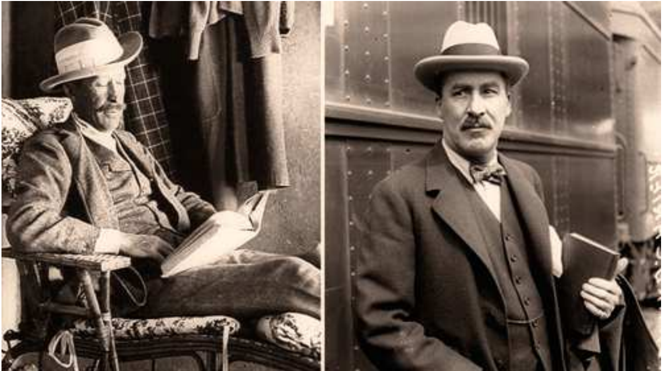
Carnarvon – Carter