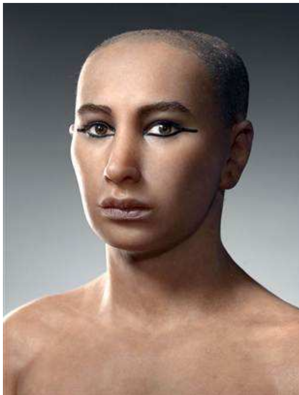
Počítačová podoba Tutanchamona