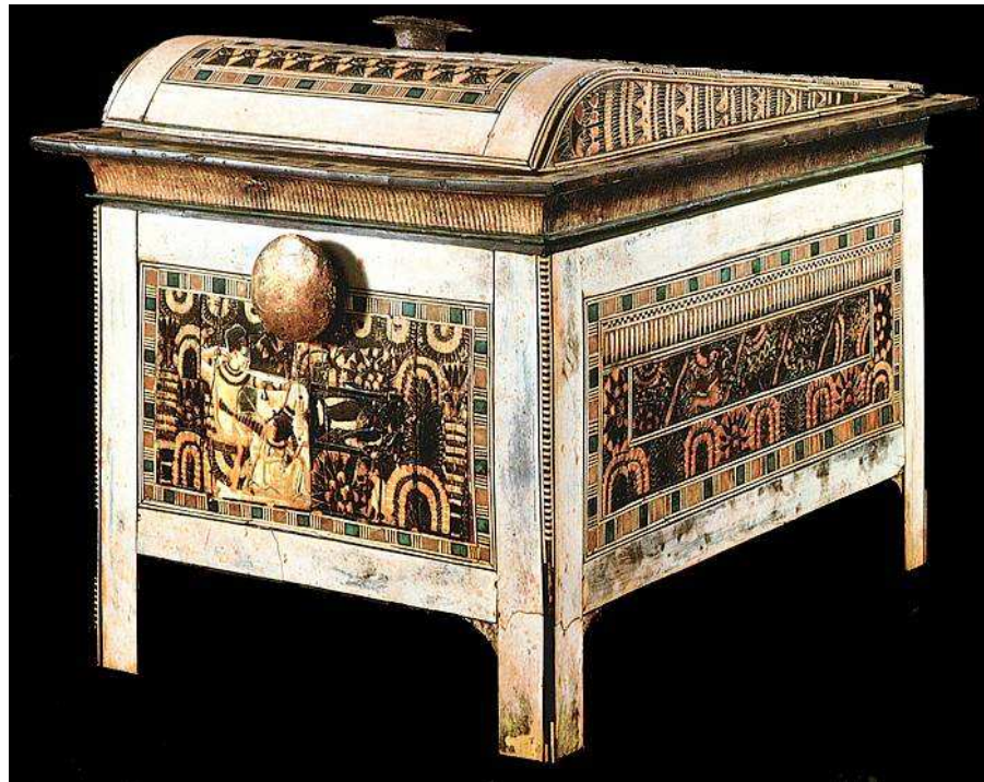
Truhla s klenutým víkem